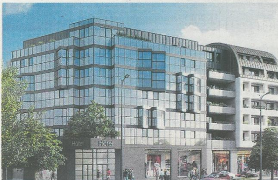
L'hôtel trois étoiles aura une façade faite exclusivement de verre, à 200 m de la Sud III

« Il n'y en a que 10 000 m 2 disponibles à Rouen ».