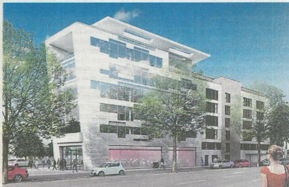
La résidence étudiante, à côté de nouveaux bureaux, sera gérée par le Crous