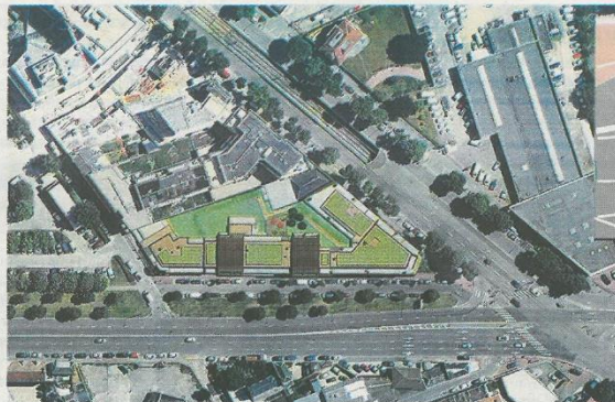
Le quartier juste derrière Saint-Sever va se transformer d'ici 2017

Double originalité au projet : pas de logements en vente et la création de repères visuels marquant l'entrée de la ville. « Tant l'hôtel, une façade toute en verre, que les bureaux,